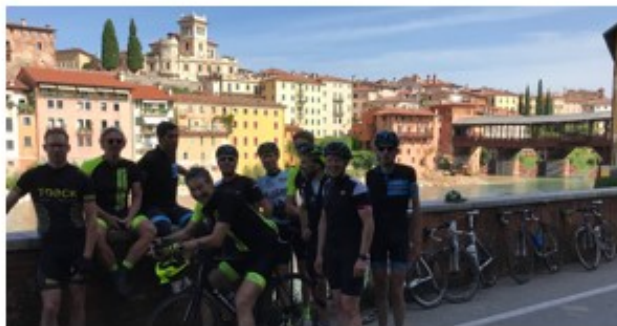
“Ponte Vecchio di Bassano” -werelderfgoed!